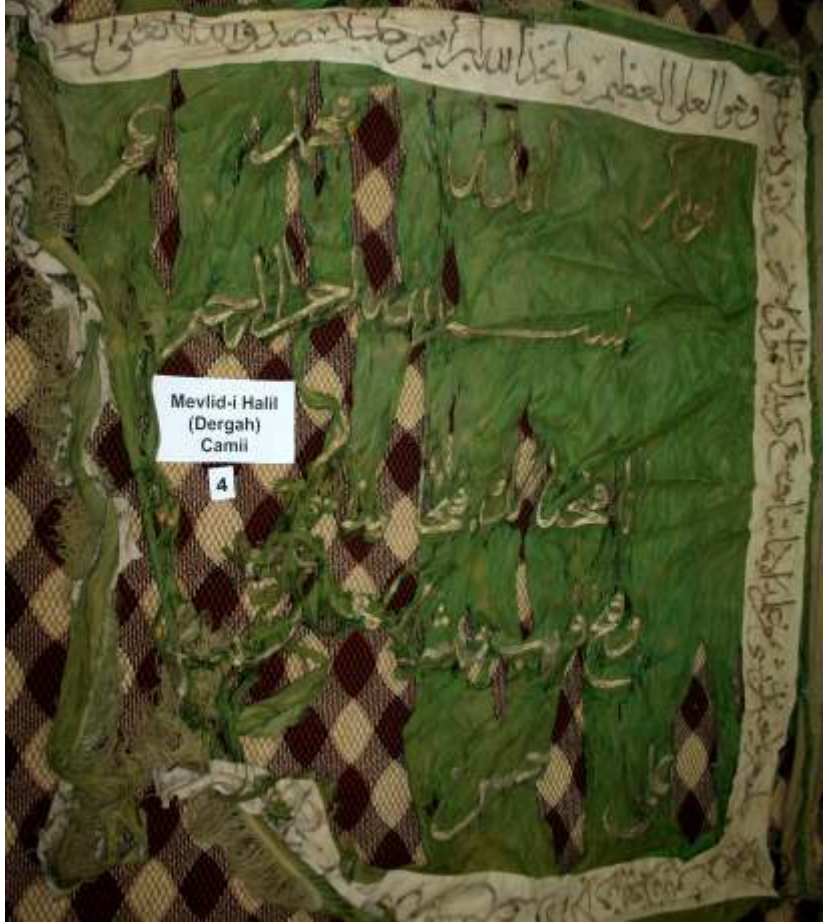
Resim-8) III Nolu sancağın konservasyon öncesi durumu.

Sancak eserimiz, gül pembesi ipek kumaş üzerine gümüş ve bakır tellerle dival işi ile tel kırma tekniğinde işlemlerle süslenmiştir. Gümüş ve bakır tela ile dal şeklindeki ince bir çizgi ile