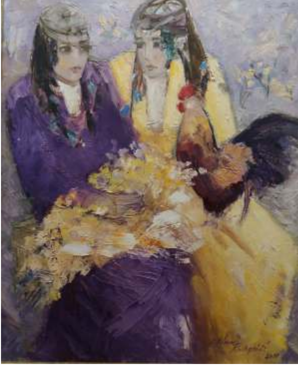
“Urfalı Köylü Kızları”, 70x100 cm, tuval üzeri yağlı boya, 2018.