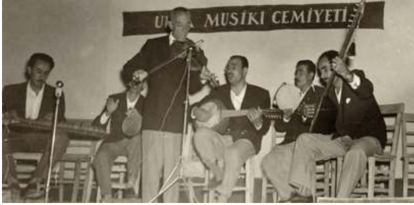
Urfa Musiki Cemiyeti konseri (1970 öncesi)

den, Dr. Faruk Subaşı, Yrd.Doç.Dr. A. Cihat Kürkçüoğlu, S. Sabri Kürkçüoğlu, Mehmet Delioğlu, Hüseyin Yeşilgöz, Mehmet Kurtoğlu, Mehmet Acet, Ahmet Al, Fuat Rasgeldi, Enver Akkaya, Mahmut Yeşildağ, İzzet Özdemir'in bilgilerinden istifade edilmiştir. Fotoğraflar için, A. Cihat Kürkçüoğlu, Sabri Kürkçüoğlu, Burhan Akar, Dede Dindar, Samet Atabay, Abdullah Uyanık ve Cevdet İşçi'nin arşivinden istifade edilmiştir. Yazıları ve fotoğraflarından yararlandığımız bu değerli kişilere teşekkürlerimizi sunarız.