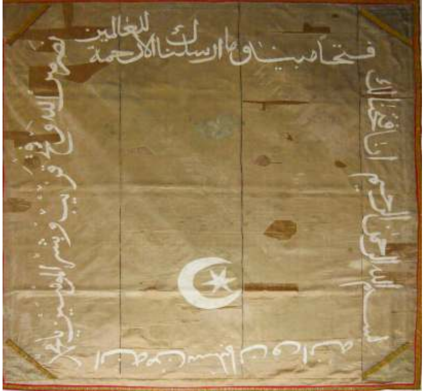
Resim-17) VII Nolu sancağın konservasyon sonrası durumu.