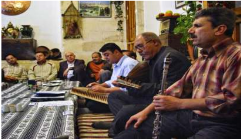
Geleneksel taş yapıları Şanlıurfa evinde müzik faslı