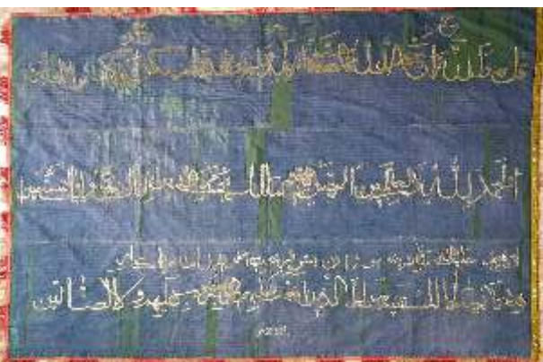
Resim-21) IX Nolu sancağın konservasyon sonrası durumu.