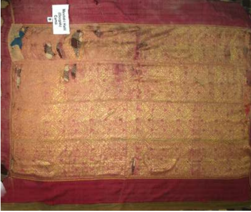
Resim-3) I Nolu sancağın konservasyonu yapılmadan önceki hali.