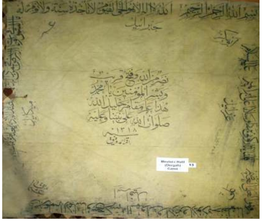
▲ Resim-26) XII Nolu sancağın konservasyon öncesi durumu.

Sonuç olarak; Tesadüf bir keşifle tespit edip korumaya aldığımız bu eserlerimizin, kendi dalında Türkiye'nin en önemli koleksiyonlarından biri olabileceği kanaatindeyim. Hiç kuşkusuz bu tarihi mirasımızın, Osmanlı döneminin sancak eserlerine yeni bir sayfa ekleyeceği ve ayrıca Şanlıurfa'nın inanç turizmine ve kültürüne büyük değerler kazandıracığı aşıkardır. Genel itibariyle Osmanlı döneminden günümüze kalabilen sancakların üzerinde ağırlıklı olarak 'fetih' ile ilgili ayetler işlenmiştir. Sancaklara işlenen fetih ile ilgili ayetler, Türk-İslam dünyasında 'fetih' ve 'gaza' ülküsünün önemini vurgular niteliktedir. Bunun dışında 'ay-yıldız' motifleri, sancaklar üzerine işlenen en yoğun desenlerdir. Dolayısıyla Sultan Abdülmecid zamanında tipolojisi belirginleşen ay-yıldızlı bayrağımızın ortaya çıkışı aşaması hususunda belirleyici bir fikir vermektedir.