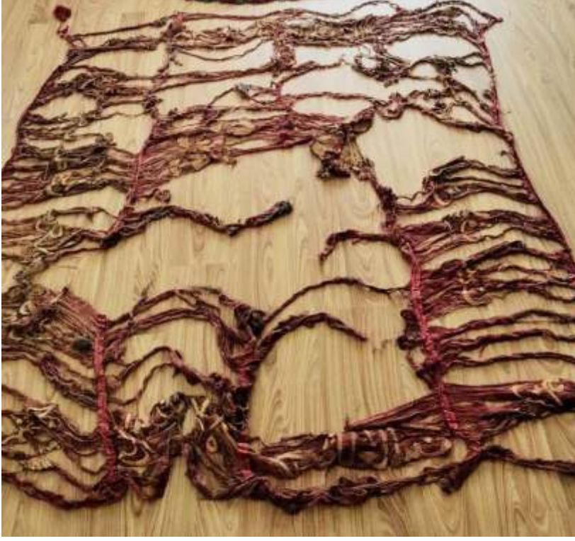
Resim-6) II Nolu sancağın konservasyonu yapılmadan önceki hali.