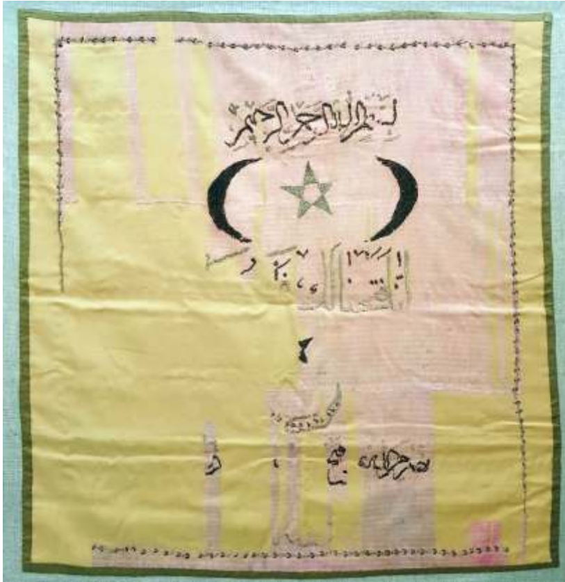
Resim-11) IV Nolu sancağın konservasyon sonrası durumu.

bordür hattı işlenmiştir. Ana zeminin en üst orta kısmında, hatları bakır, hareketleri ise gümüş olan tela ile işlenmiş 'Besmele' yer almaktadır. Basmelenin altında iç yönleri birbirine dönük, bakır tela ile iki adet hilal motifi işlenmiştir. İki hilalin ortasında da gümüş tela ile işlenen yıldız motifi yer almaktadır. Hilal ve yıldızın altında da hatları gümüş, hareketleri bakır teladan 'Şüphesiz biz sana apaçık bir fetih bağışladık' mealindeki Fetih suresinin 1. ayeti işlenmiştir. Ayetin altında da yarısı tahrip olmuş, bakır tela ile yıldız ve iç yönü yukarı dönük gümüş tela ile işlenmiş hilal deseni yer almaktadır. Sancağın en alt kısmında ise hatları bakır, hareketleri gümüş ile işlenmiş, ancak büyük bir kısmı yok olmuş, 'Ey Muhammed! Allah'ın yardımıyla size ihsan edilen fetih zaferini müminlere müjdele' mealindeki Saff suresinin 13. ayeti işlenmiştir. En alt kısımda sene ibaresi olsa da tarih rakamları yok olmuştur. Dokuma ve işleme tekniğinden ve benzer örneklerinden dolayı 19. yüzyıl içerisinde dokunduğu tahmin edilmektedir.