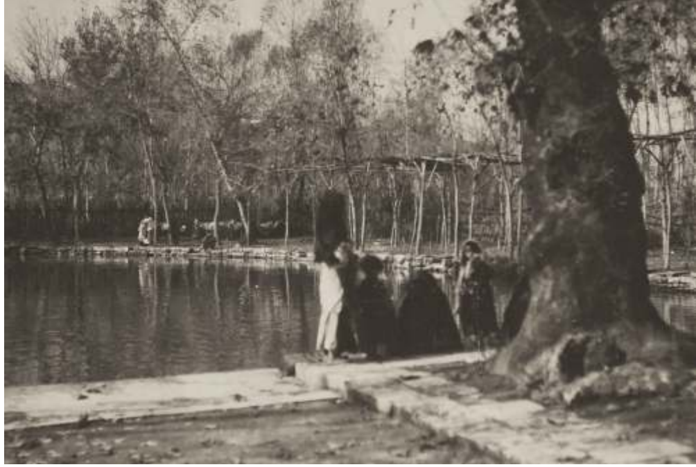
20. yy. başlarında Aynzeliha Gölü

Ertesi gün sekiz saat boyunca, güneş doğduktan sonra dayanılmaz olan yansımalarının alçak kireçtaşı tepeleri üzerinde Fırat Nehri üzerinden Bir veya Birecik'e yolculuk yaptık. Yollar çok iyiydi, ancak kısa bir süre önce yolculuğumuzda geçtiğimiz kazdırılmış büyük bir su deposu,(8) yakın zamanda Hafız Paşa tarafından yaptırılmıştı. Biraz dinlenmek ve ferahlamak için durduğumuzda, dervişe benzeyen bir adam bize yaklaştı. Yılanlı bir büyücü olduğunu iddia etti ve sürüngenlerden birini pelerinin altından çekip değişik kıvrımlardan geçmeye zorladı ve bir kolye gibi boynuna dola- yarak bitirdi.