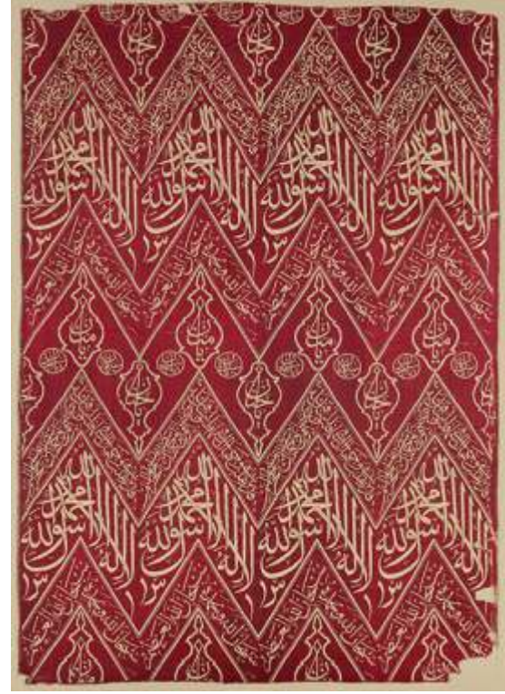
Resim-5) 17.yüzyılda Osmanlı dokuması Kabe iç örtüsü. (New York Metropolitan Müzesi)

Kâbe iç örtüsü olduğu düşünülmektedir. Çünkü Kabe iç örtüleri, genellikle kutnu (atkısı pamuk, çözgüsü