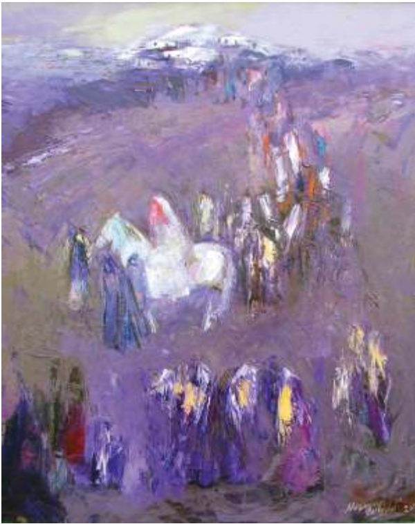
“Köyde Gelin Alayı”, 90x75 cm, tuval üzeri yağlı boya, 2012.