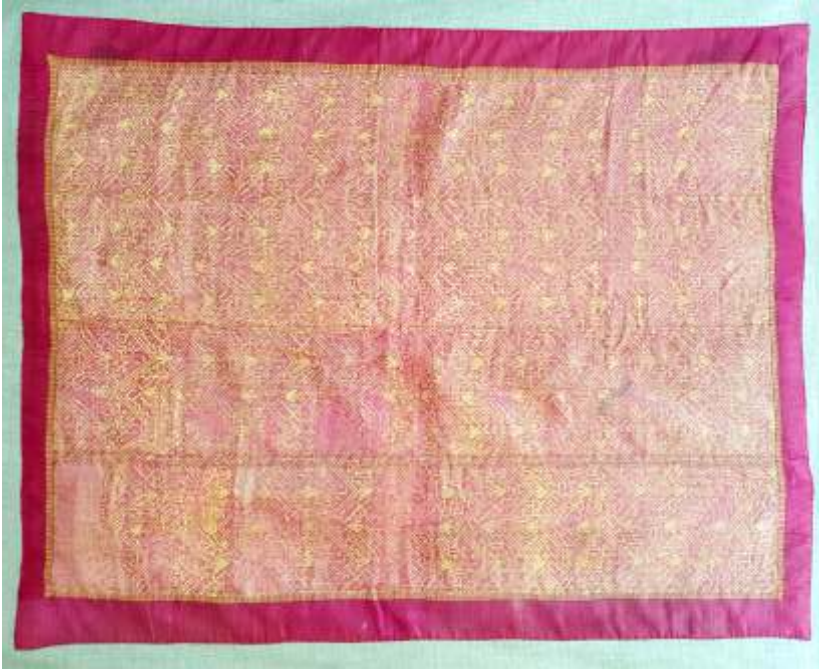
Resim-4) I Nolu sancağın konservasyon sonrası durumu

Çok nadir olarak bazı işlemlerde veya ayrıntılarda 'zerbaft' adı verilen altın işleme tekniği uygulanmıştır. Sancaklar için kullanılan kumaşların ağırlıklı olarak bu bölgedeki tezgahlarda dokunduğu düşünülmektedir. Çünkü Şam, Halep ve Gaziantep'te dokunan