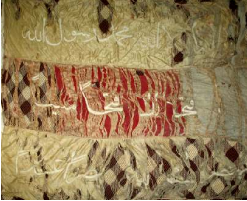
Resim-14) VI Nolu sancağın konservasyon öncesi durumu.