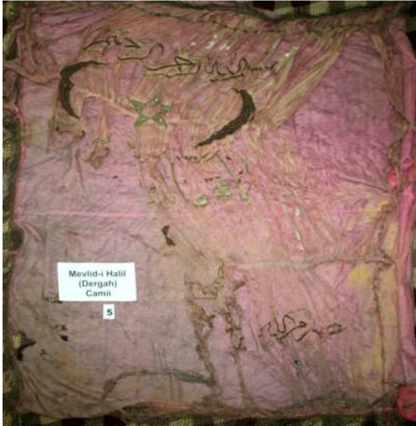
Resim-10) IV Nolu sancağın konservasyon öncesi durumu.