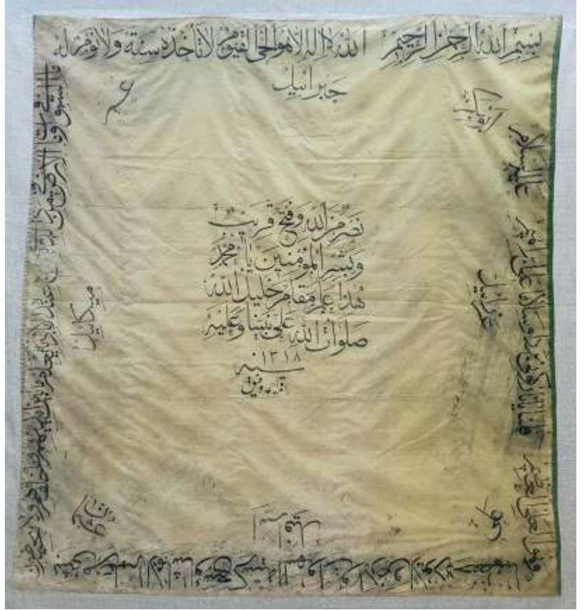
▲ Resim-27) XII Nolu sancağın konservasyon sonrası durumu.