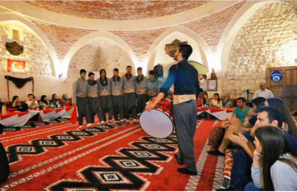
Şanlıurfa'da Konukevinde Sıra Gecesi Programı

turlarında turistlere, gündüz Şanlıurfa tarihi, turistik ve dini mekân gezisi, akşam Sıra Gecesi şeklinde program sunmaya başlamıştır. Her gelen grup sıra gecesi isteyince pek çok ev, konukevine dönüştürülmüş ve pek çok müzik gurubu ortaya çıkmıştır. Günümüzde 50'ye yakın müzik gurubu konukevi ve otellerde Şanlıurfa'ya gelen misafirlere müzik sunmaktadır. Bu gecelerde geleneksel müzik parçaları yanında günün sevilen türküleri ve oyun havalarına da yer verilmektedir. Düzenlenen etkinliğin ismi her ne kadar "Sıra Gecesi" olsa da aslında bu etkinlikler turistlere hoşça vakit geçirmek üzere, düzenlenen müzik-eğlence geceleridir.