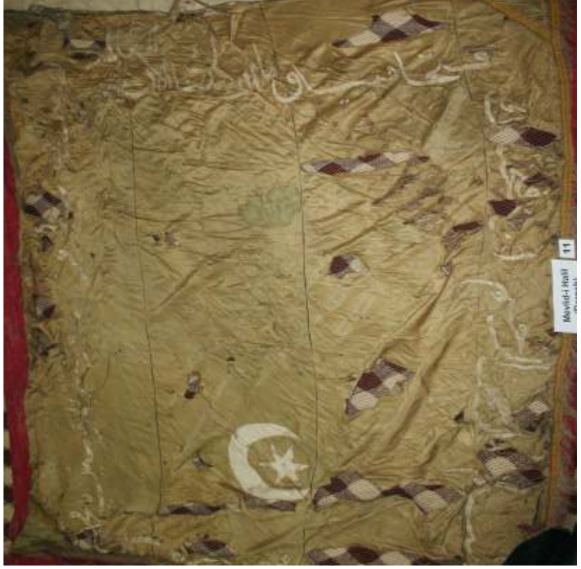
Resim-16) VII Nolu sancağın konservasyon öncesi durumu.

Asıl zemin rengi yeşil olan sancağın kumaş atıklarının deforme olması nedeniyle çözümleri rengi olan açık lacivert rengine dönüşmüştür. İpek saten karışımı kumaş üzerine altın ve gümüş karışımı (elektron) telalar ile tel kırma tekniğinde hatlar işlenmiştir. En üstte sağ tarafta 'Hasan' sol tarafta ise 'Hüseyin' ismi yer almaktadır. İlk satırda 'De ki; Allah tektir. O, kimseye muhtaç değildir, her şey O'na muhtaçtır. O, doğmamış ve doğurmamıştır. Hiçbir şey O'na denk değildir.' mealindeki tüm İhlas suresi işlenmiştir. İkinci ve son satırda 'Hamd alemlerin Rabbi, Rahman ve Rahim olan, hesap ve ceza-mükafat gününün sahibi olan Allah'a mahsusdur. Allah'ım! yalnız sana ibadet eder ve yalnız senden yardım dileriz. Bizi doğru yola, kendilerini mükâfatlandırdıklarının yoluna ilet, cezalandırdıklarının yoluna değil.' mealindeki Fatiha suresinin tümü işlenmiştir. Sancağın üçüncü satırında ise 'İbrahim Halilullah makamı şerifine yüz on beş ker'esi efradı şahanesi yad egler.' En alt kısımda 'sene 1321' (Miladi 1902) tarihi işlenmiştir. Üç tarafının saçağı sarı ve kırmızı ipek püsküllü olup, direk kısmına bağlanan saçağı ise altın sırma işlemelidir.