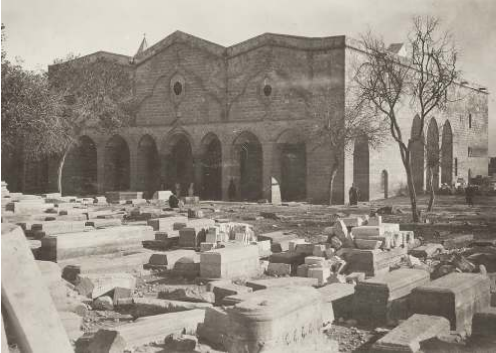
Azize Meryem Ana Kilisesi, Günümüzde Selahaddin Eyyubi Camii

eserlerin bile kopyalarının çoğaltılmasının yasaklandığı bir ülkedeki durumu şikâyet ediyorlardı.