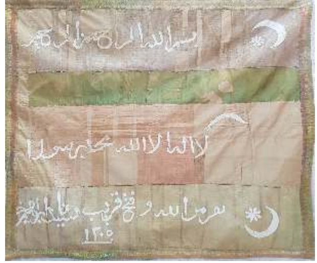
▲ Resim-23) X Nolu sancağın konservasyon sonrası durumu.

cağın, üzerine mürekkep ile yazılan ayetler ve kitabelerin hat konturları dağılmış durumdadır. Aşırı nemden dolayı akmış olan ve kumaş yüzeyine bulaşmış mürekkep lekelerinin bitkisel kökenli temizleyicilerle temizlenmesine çalışılmış, ancak kumaşın daha fazla deformasyona uğramaması ve zarar görmemesi için kimyasal temizleyiciler kullanılmamıştır. Az miktarda fiziksel ve kimyasal bozulmalar ile renk solması gözlemlenebilmektedir. 194x180 cm ölçüsündedir. (Resim-26,27)