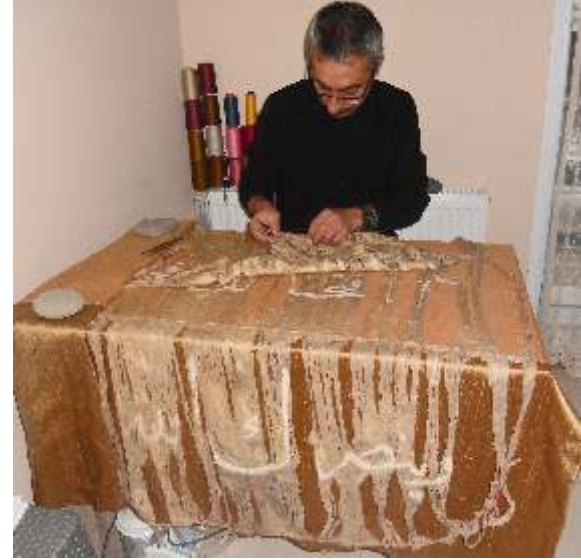
Resim-2) Sancak eserlerin konservasyon aşaması.

Osmanlı Dönemi'nde Şanlıurfa'nın el sanatlarından, özellikle dokumacılık önem kazanmıştı. Şehirde çeşitli dallarda dokumalar yapan tez-