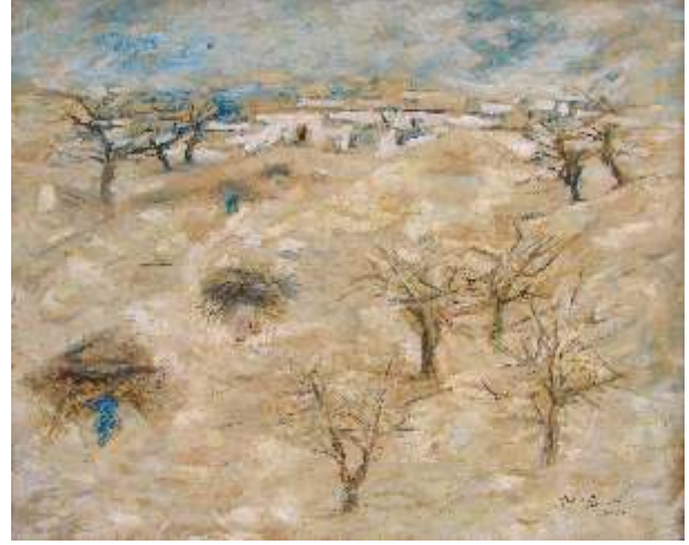
"Çırpı Taşıyanlar", 8x100 cm, tuval üzeri yağlı boya, 1983.