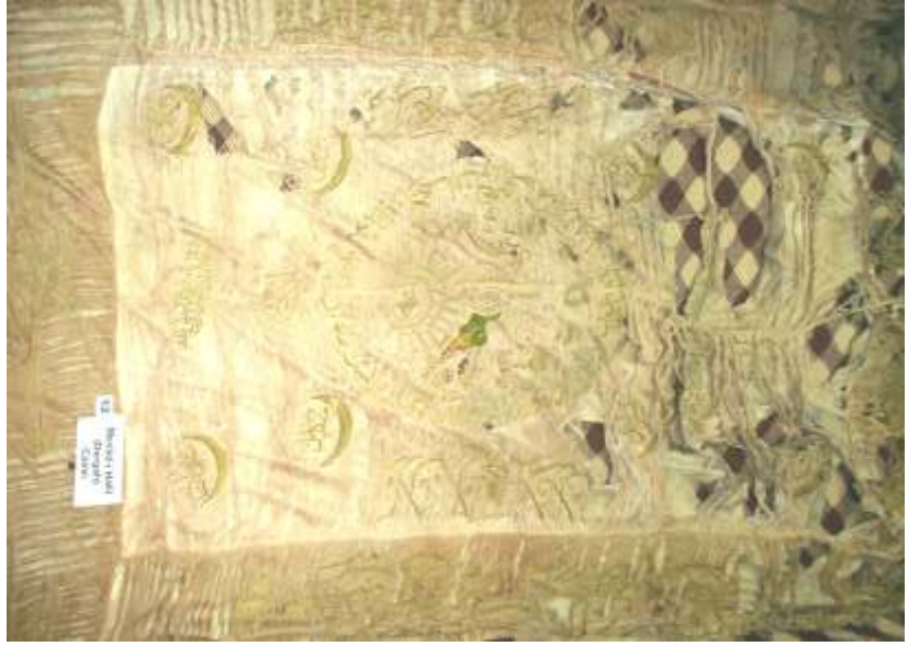
▲ Resim-24) XI Nolu sancağın konservasyon öncesi durumu.