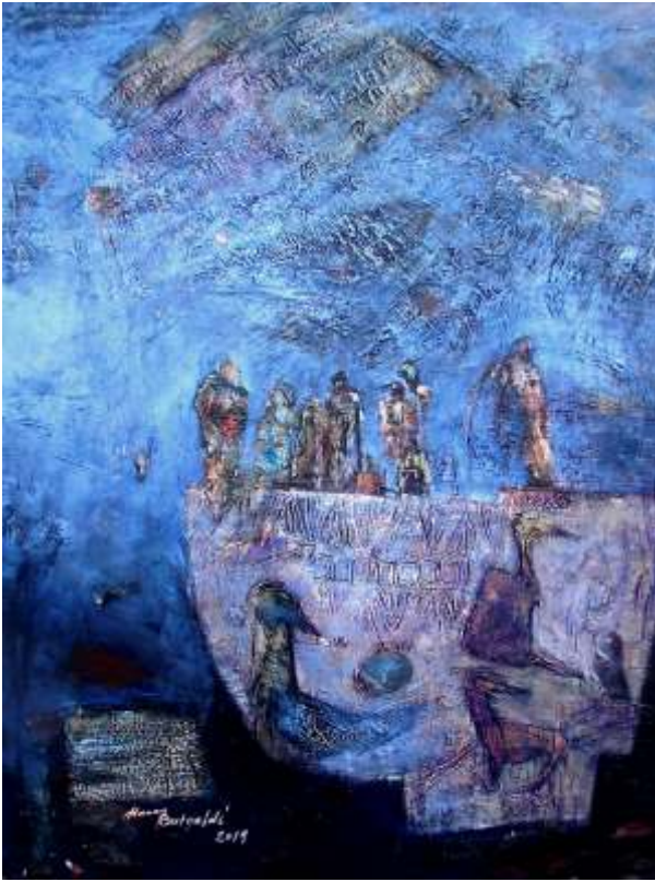
"Göbeklitepe" serisi, 170x130 cm, pullu kumaş üzeri akrilik, 2019.