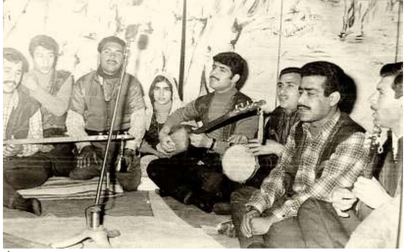
Halk Eğitim Merkezi salonunda Şanlıurfalı Sanatçılar konseri (1970'lerin başı)