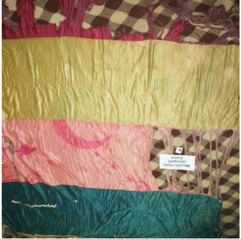
Resim-12) V Nolu sancağın konservasyon öncesi durumu.

Zemindeki hatlar ve motifler beyaz saten kumaş kesilerek işlenmiştir. Ortaya yakın bir kenar kısmında ay-yıldız