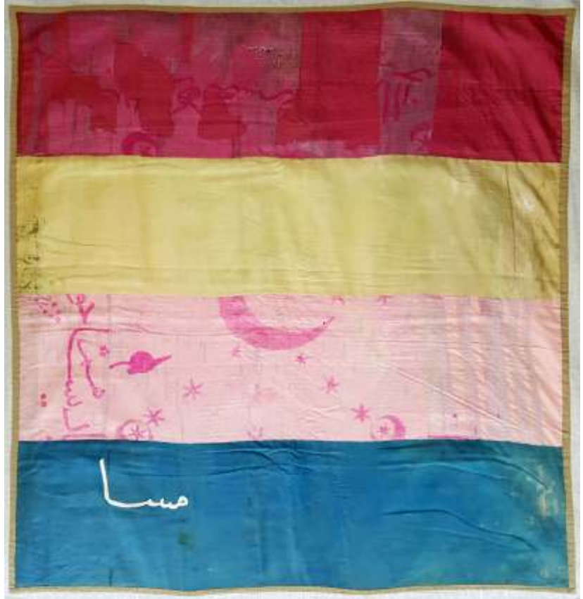
Resim-13) V Nolu sancağın konservasyon sonrası durumu.