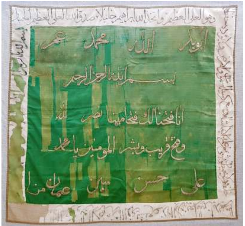
Resim-9) III Nolu sancağın konservasyon sonrası durumu.