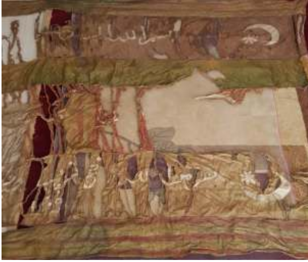
▲ Resim-22) X Nolu sancağın konservasyon öncesi durumu.