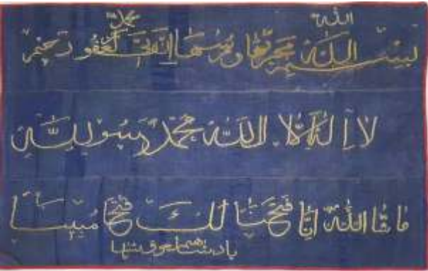
Resim-19) VIII Nolu sancağın konservasyon sonrası durumu.