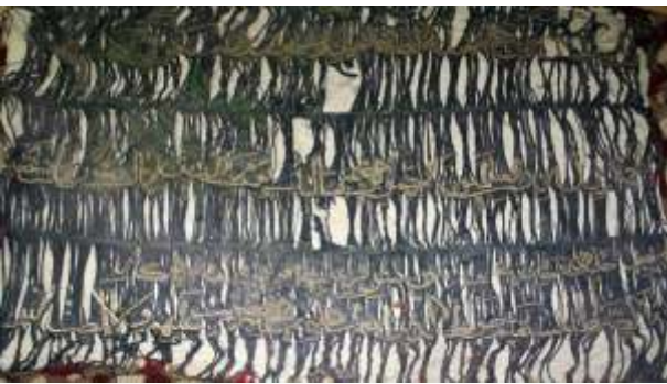
Resim-20) IX Nolu sancağın konservasyon öncesi durumu.