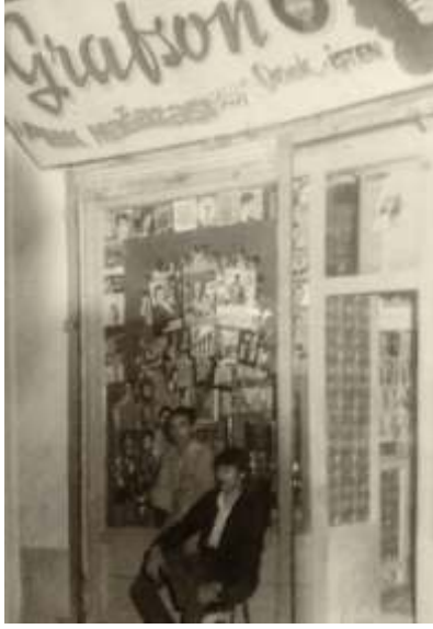
▲ Urfalı'da 1970'lerde bir plakçı dükkânı

falt Caddede'de açtığı Çataltaş Plak 1980'lere kadar plak satışına devam etti". Durak İçten'de Grafson Plak olarak bir müddet faaliyetini sürdürdü.