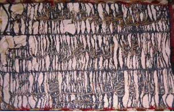
Resim-18) VIII Nolu sancağın konservasyon öncesi durumu.