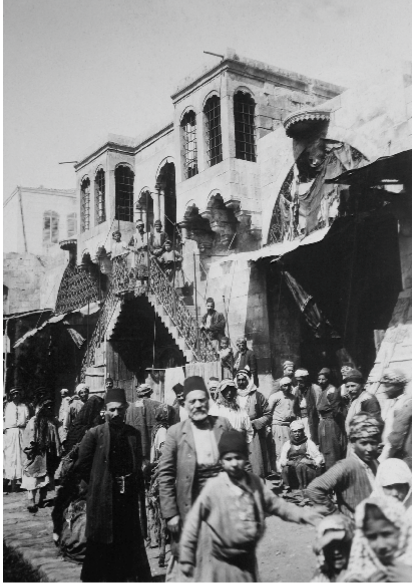
1910'lu yıllarda Hüseyin Çarşılıca terasında yer alan Çardaklı Kahve

Tarihte ilk ses kaydının 1877 yılında Thomas Edison'un (1847-1931) geliştirdiği "Fonograf" aygıtı ile yaptığı kaydedilmektedir. (25) 1894'te ABD'li mucit Emil Berliner'in geliştirdiği fonograf aygıtı, "Gramofon" adı ile tescil edildi. Bizim gramofonla tanışmamız 1900 yılında, II. Abdülhamid döneminde gramofonun İstanbul'a gelmesiyle başlamıştır. Türkiye'de ilk plak fabrikası 1912 yılında kurulmuştur. Hafız Sami Efendi, Hafız Osman gibi sanatçıların okudukları gazeller başta olmak üzere çeşitli sanatçıların icra ettikleri, şarkılar, türküler, kantolar, Taş Plaklara kaydedilmiştir.