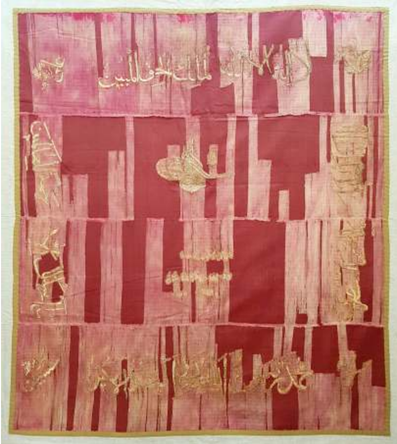
Resim-7) II Nolu sancağın konservasyon sonrası durumu.