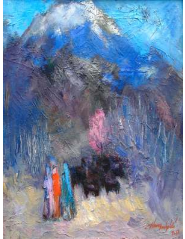
“Toroslarda Sonbahar”, 50x60 cm, tuval üzeri yağlı boya, 2012.