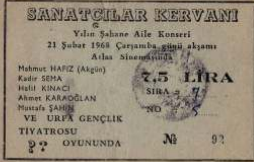
Atlas Sineması'nda 1968 yılında düzenlenen bir konserin bileti

matine ve suare gösterileri yapılırdı. Bu sinemaların hepsi kapanmış olup, sadece Emek Sineması(19) ile Abide Park, Urfa City, Novada ve Piazza Alışveriş merkezlerindeki sinemalar faaliyetine devam etmektedir.