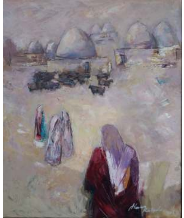
“Harran'dan”, 120x100 cm, Tuval üzeri yağlı boya, 2018.