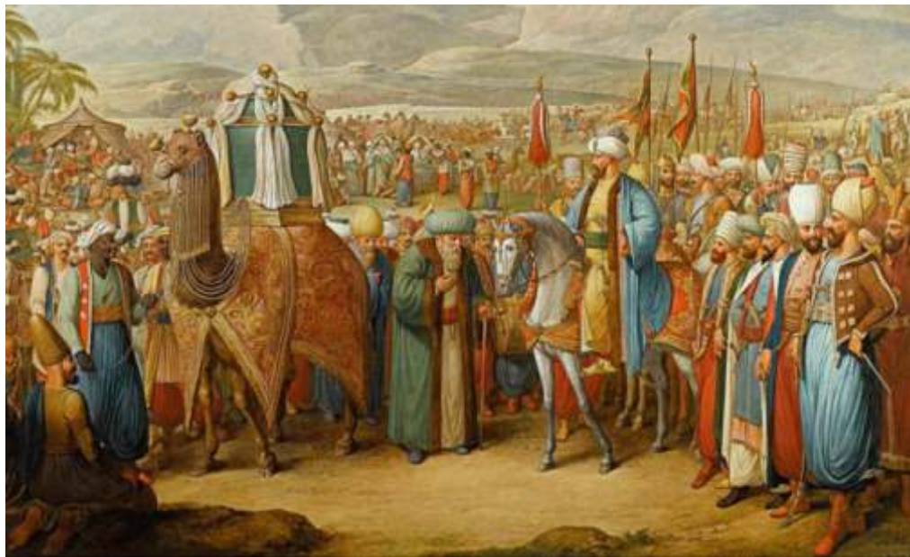
▲ Resim-1) Osmanlı dönemi Surre Alayı (Sürre-i Hümayun) töreni.

Sürre Alayı denilen ve her sene yenilenen Kâbe örtüsünü götürmek üzere yola çıkan alayın özel bir sancağı ve sancak kılıfı bulunmaktaydı. İslam devletleri arasında çok önem taşıyan konulardan biri olan Kabe örtü-