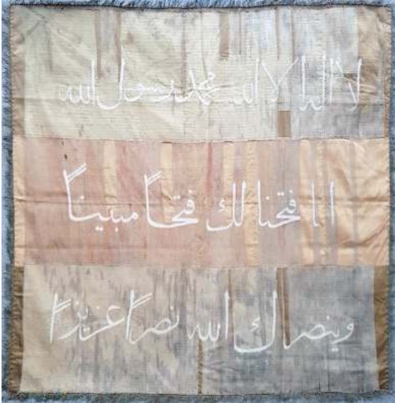
Resim-15) VI Nolu sancağın konservasyon sonrası durumu.

motifi işlenmiştir. Sol alt kenardan başlayarak sağa doğru 'innehu min süleymane ve innehu Bismillahirrahmanirrahim (Nem suresi-30), İna fethna leke fethan mübina (Fetih suresi-1), Vema erselnake illa rahmeten lil alemin (Enbiya suresi-130), Nasrün minallahi ve fethun karibun ve beşşiril müminine ya Muhammed (Saff suresi-13) ayetleri işlenmiştir. Farklı surelerdeki bu ayetlerin sırasıyla mealî 'Süleymandan gelen bir mektup var, Rahman ve Rahim olan Allah'ın adıyla başlayan, Şüphesiz Biz sana apaçık bir fetih ihsan ettik, Ey Peygamber! Biz seni alemlere rahmet olarak gönderdik, Ey Muhammed! Allah'ın yardımıyla gelen fetih zaferini müminlere müjdele.' anlamındadır. Sancağın üzerine işlenmiş ay-yıldız motifinin bayrak ve sancaklarımızdaki ortaya çıkışı göz önünde bulundurulursa tarih düşülmemiş sancağı, 19. yüzyıl'ın ikinci yarısına tarihlemek mümkündür.