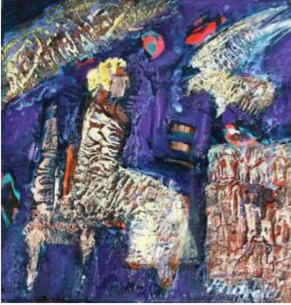
"Sinope", 40x40 cm, karışık teknik, 2015.