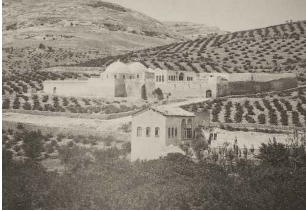
Surp Sarkis Manastırı ve Şair Sakıbn Köşkü

Günbatımında, açık havada bağdaş kurup, harika bir akşam yemeğine, değerli ev sahibimiz, Yunan doktor ve biraz keyfine düşkün gibi görünen