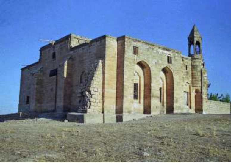
Ağvıran Köyü (Bahçeli Köyü Arıpınar Mezrası) Hüseyin Paşa Camii

miş ve irşatla meşgul iken bu tarihlerde Hâfız Muhammed Selim Efendi de Urfa'dan Süleymaniye'ye giderek, Mevlânâ Halid hazretlerine intisap etmişti.(6) Bu sırada Mevlânâ Halid, Muhammed Selim Efendi'ye: "Ey Muhammed Hâfız! Arkadaşın bana tâbi olacağını söylemedi mi?" diye sorunca Muhammed Selim Hâfız da; "Evet" diyerek, o büyük zata hürmet göstermişti.