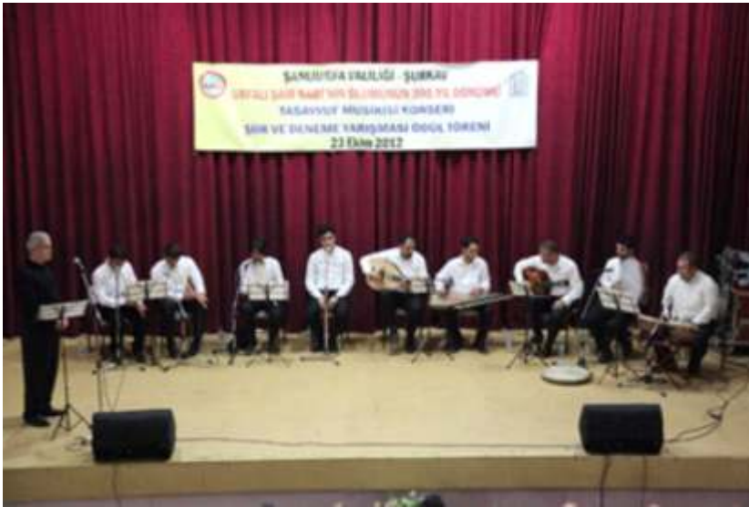
ŞURKAV Müzik Topluluğu konseri

- 6 Nisan 1999 Osmanlı Devleti'nin 700. Kuruluş yılı münasebetiyle