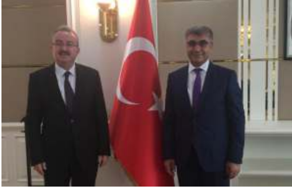
▲ Mukim Tahir etkinliği için Karabük Valisi Fuat Güreli ziyaret