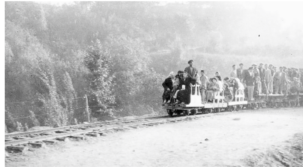
Yenice Orman Dekovili 1940'lı yıllar

Bir zamanlar çaldığı sazlar ve söylediği türkülerle adından söz ettiren müzik dehası Mukim Tahir, zenginlikten fakirliğe düşmesini bir türlü içine sindiremez.