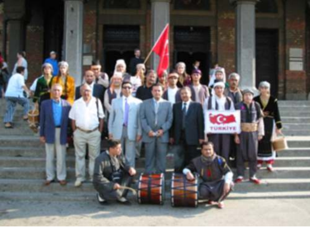
▲ Romanya'daki Festivale katılan ŞURKAV yönetici ve Halk Oyunları ekibi