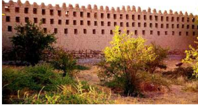
Hüseyin Paşa Camii'nin kerpiçle örülü duvarlarında yer alan kuş takaları

"Allah'ın zatına yaraşır şekilde O'na hamd ederim. Salât