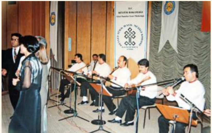
Devlet Korusu Konseri /1994

2002-2020 yılları arasında Şanlıurfa Gençlik Spor Müdürlüğü'ne bağlı Şanlıurfa Gençlik Merkezlerinde bağlama ve ses eğitimi verdi. 2003 yılında Türkiye Gençlik Merkezleri arası ses yarışmalarında öğrencileri Türkiye birinciliği ve ikinciliği ödülleri aldı. Ayrıca verdiği kurslarla, konservatuar ile müzik okullarını çok sayıda öğrencisi kazandı. Eğitimi olarak müzik dünyasına Urfalı gençlerden ses ve saz olarak birçok sanatçı yetiştirdi.