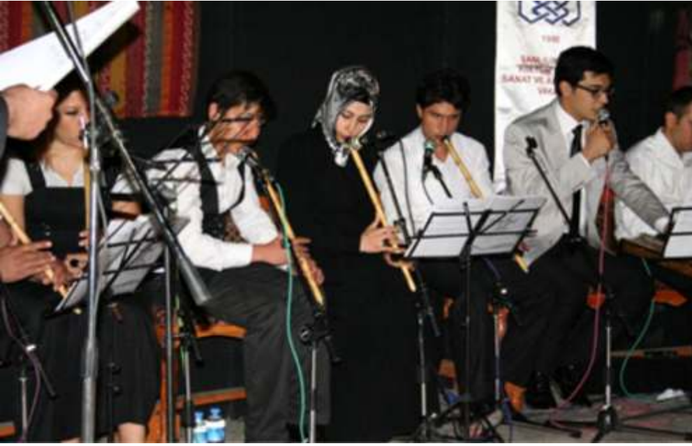
ŞURKAV Tasavvuf Müziği Topluluğu

dımlaşma ve dayanışma geceleridir. Müzik yönü ile Sıra Gecesi bir halk konservatuarıdır. Gençlere, usta-çırak geleneği içinde müzik eğitimi verilir. Bu geleneksel gecelerde icra edilen müzik, televizyon ve radyo yayıncılarının dikkatini çekmiş ve Şanlıurfa Sıra Gecelerinde kaydedilen görüntü ve sesler radyo ve televizyonlarda sık sık yayınlanmıştır. Sıra Gecesindeki müzik faslına, televizyon dizlerinde ve sinema filmlerinde yer verilmiştir. Böylece Sıra Gecesi yurt içi ve yurt dışında tanınmıştır. Bunun üzerine Şanlıurfa'ya gelen misafirler, siyaset adamları ve bürokratlar ile turistler sıra gecesi müzik programlarına katılmayı arzu etmişlerdir.