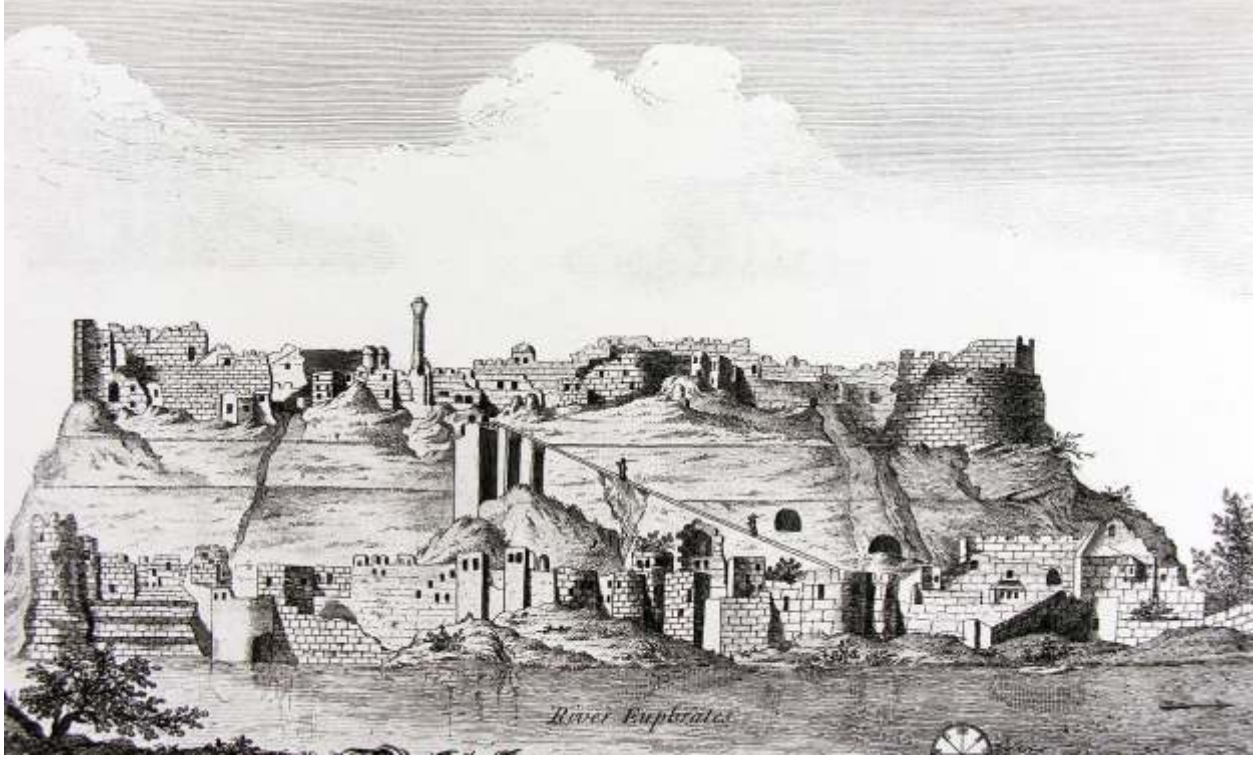
18. yy. ortalarında Fırat'ın batı yakasından Birecik'i gösteren gravür , (Çizim J.S. Müller Drummond)

toplarını atacak kadar büyük taşların bazılarını görmüştüm kalede. Öyle ki, bazı makineler tarafından yönetilmeleri gereken iplere bağlı kordonlar var.(10) Çoğu kimse bunların eski Roma silahları olduğu görüşündeydi ve Ammianus Marsellinus'un onlara verdiği açıklama ile çok iyi uydukları kesindi; ancak Romalıların bu ordularını en mükemmel hale getirdikleri düşünülebilir ve oklar hakkında Arapça ve diğer Doğu dilleriyle yazılmış birçok makalede görüldüğü gibi, ateşli silahların icat edildiği zamana ait kalede olan silahlar olduğu sonucuna varılabilir.