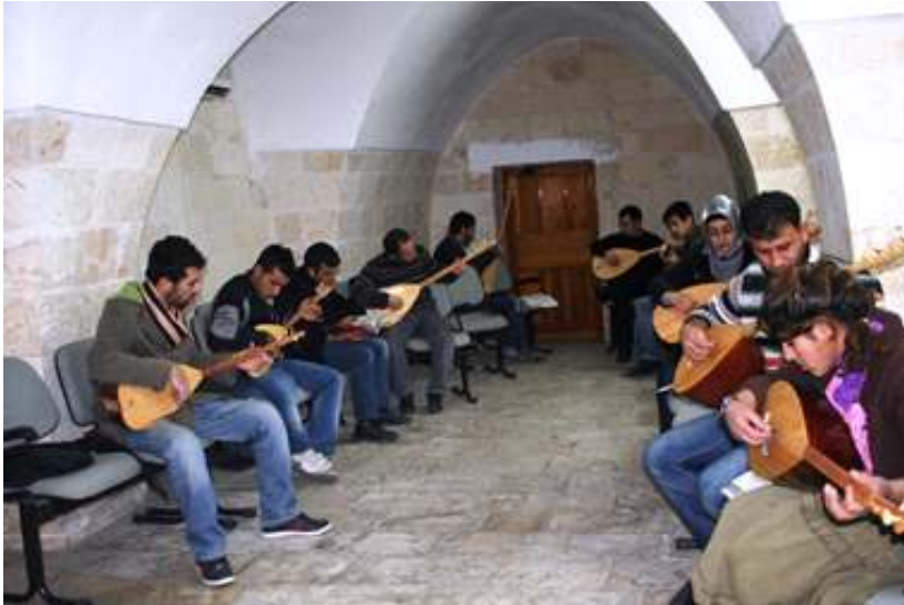
ŞURKAV Bağlama Kursu