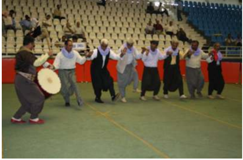
50 Yaş üzeri Köyler Arası Mahalli Halk Oyunları Yarışmasında Bir Köy Ekibi

- 24.05.2012 tarihinde Balıklıgöl Amfi Tiyatroda Şef Hüseyin AKPINAR yönetiminde ŞURKAV Tasavvuf Tasavvuf Musikisi Konseri düzenlendi.