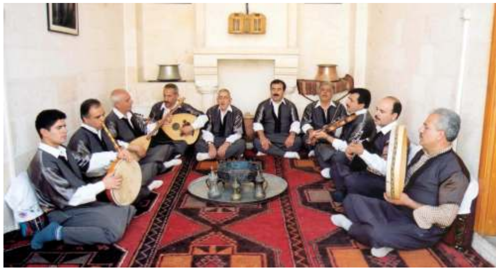
ŞURKAV bünyesinde 1994 yılında kurulan Urfa Sıra Gecesi Müzik Ekibi

Şanlıurfa'da arkadaş guruplarının her hafta birinin evinde olmak üzere sıra ile yaptıkları geleneksel toplantılara "Sıra" veya "Sıra gecesi" denir. Bu gecelerde sohbet edilir, müzik icra edilir. Geleneksel "Tolaka" ve "Yüzük Fincan Oyunu" gibi geleneksel oyunlar oynanır, çiğköfte ve mahalli tatlılar yenir. Sıra Geceleri sohbet, muhabbet, yar-