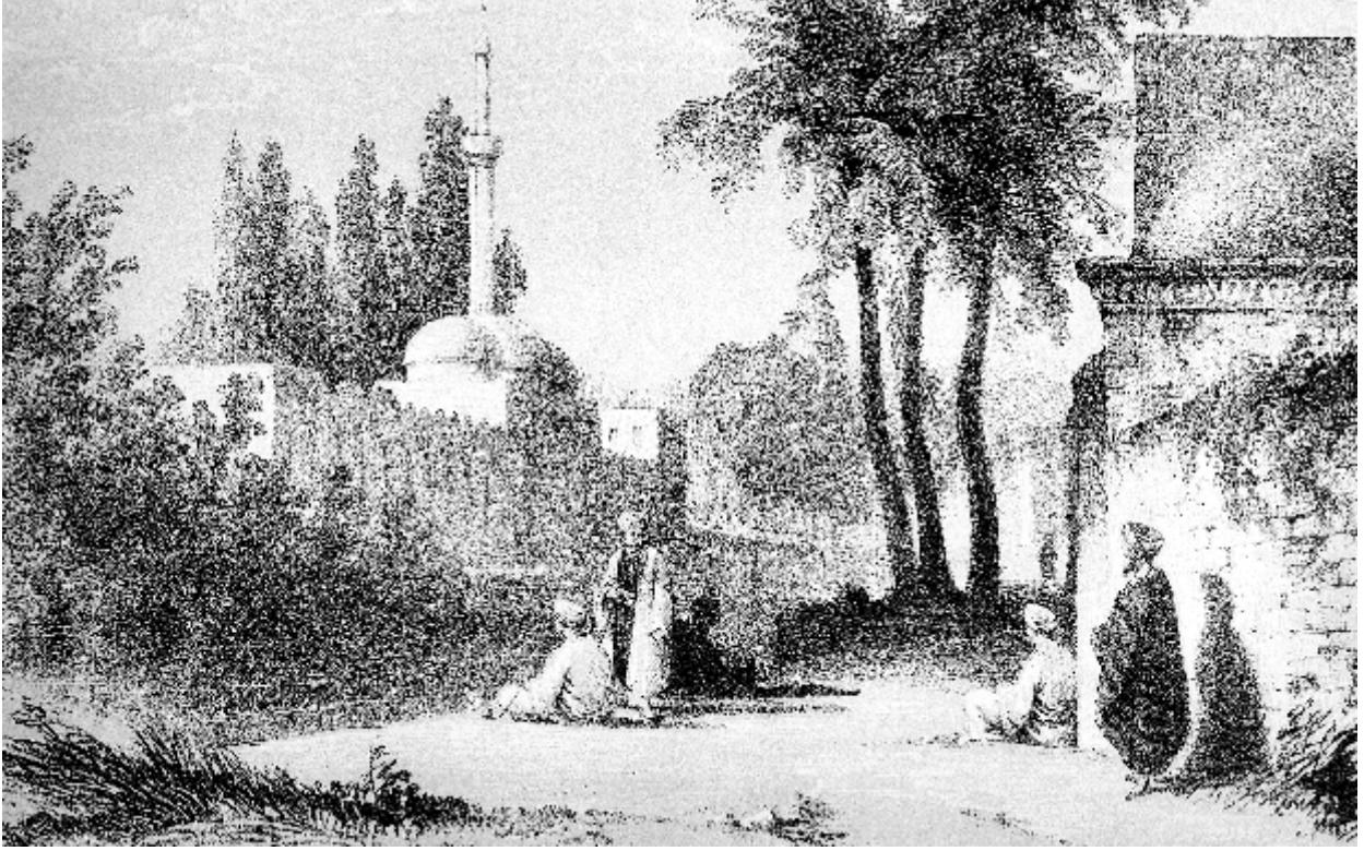
19. yy. ikinci yarısında Rıdvaniye Camii, (Çizim Estcourt)

tepeye çıktık ve yarım saat içinde, sonunda bir tepede, yıkık bir kilisenin bulunduğu bazı önemli kalıntılara geldik. Bir saat daha ilerlediğimizde Rulik adında yıkılmış bir yere geldik, burada biri mezarlık üzerine inşa edilmiş, kemerli bir girişe sahip iki ev vardı ve yakınlarında neredeyse tam bir kilise var. Burada bazı Rışvanlı Kürtleri mısırlarıyla ilgileniyorlardı ve bunlardan biri bize bir mil daha yakın olan ve çok sayıda çadırlarına giden yolu gösterdi; onlar tarafından iyi karşılandık ve bize bir bulgur lapası ve dört süt getirdiler. Bazı tavaları döverek dua törenlerini gerçekleştirdiler ve bana aydaki bir değişiklikten(2) kaynaklandığını söylediler. Onların çadırlarının yanına yerleştim.