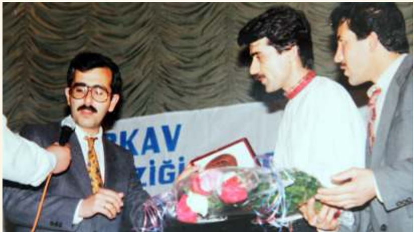
Halk Müziği Konserinde Vali Yardımcısı Hasan Duruer'in plaket takdimi/1994