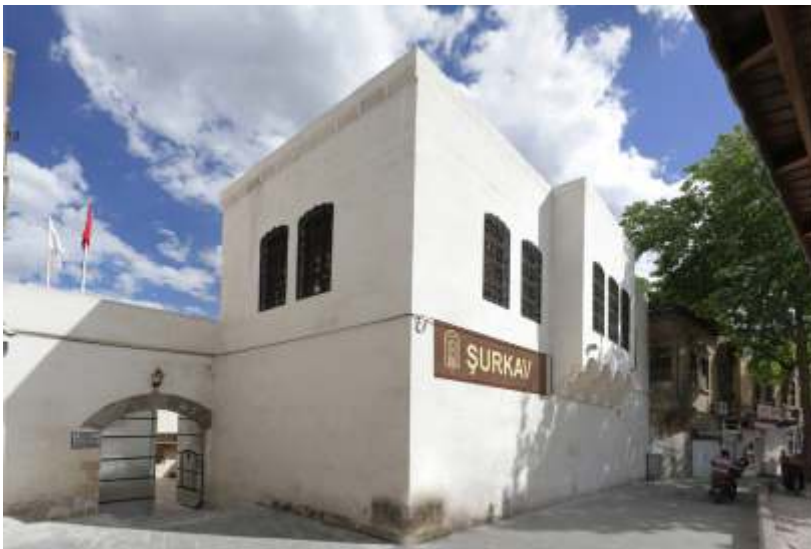
ŞURKAV Kültür Merkezi

Daha önemlisi "Dergâh-Balıklığöl Projesi" çalışmalarını yıkılmaya yüz tutmuş Urfa evlerini alıp restore ederek konuk evi, taziye evi, kültür merkezi gibi çeşitli fonksiyonlar kazandırmasıyla Şanlıurfa'da Geleneksel Mimarinin yok olmasını önlemiştir. Gelen misafirlerimizi göğsümüzü kabartarak gezdirebileceğimiz bir "Dergâh-Balıklığöl Çevre Düzenleme Projesi"ni gerçekleştirmiştir.