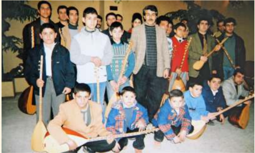
Belediye Çocuk Korusuyla/2003