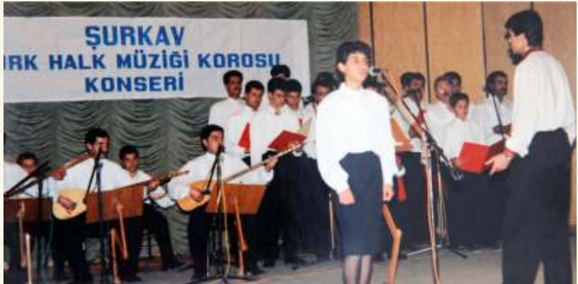
ŞURKAV Halk Müziği Topluluğu/1994